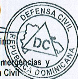
Rafael Antonio Carrasco Paulino General de Brigada ERD Presidente de la Comisión Nacional de Emergencias y Director Ejecutivo de la Defensa Civil

MANIFIESTA: Su aprobación al proceso de Comparación de Precio para la Adquisición de combustible en tickets prepagados para ser utilizados en los vehículos y distribuidos a los funcionarios al servicio de esta institución por los meses de enero a junio del año en curso. (REFERENCIA DCD-CCC-CP-2020-0001)